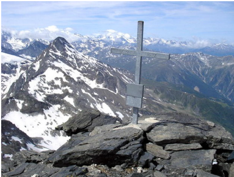
Panorama dalla vetta verso il Sempione e i Mischabel