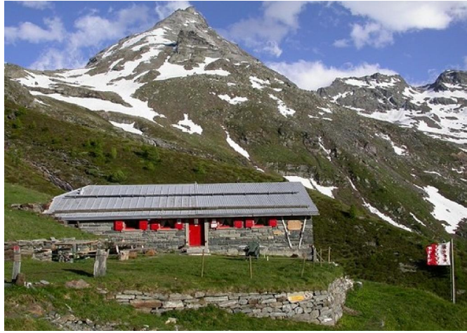
Il rifugio Bortel