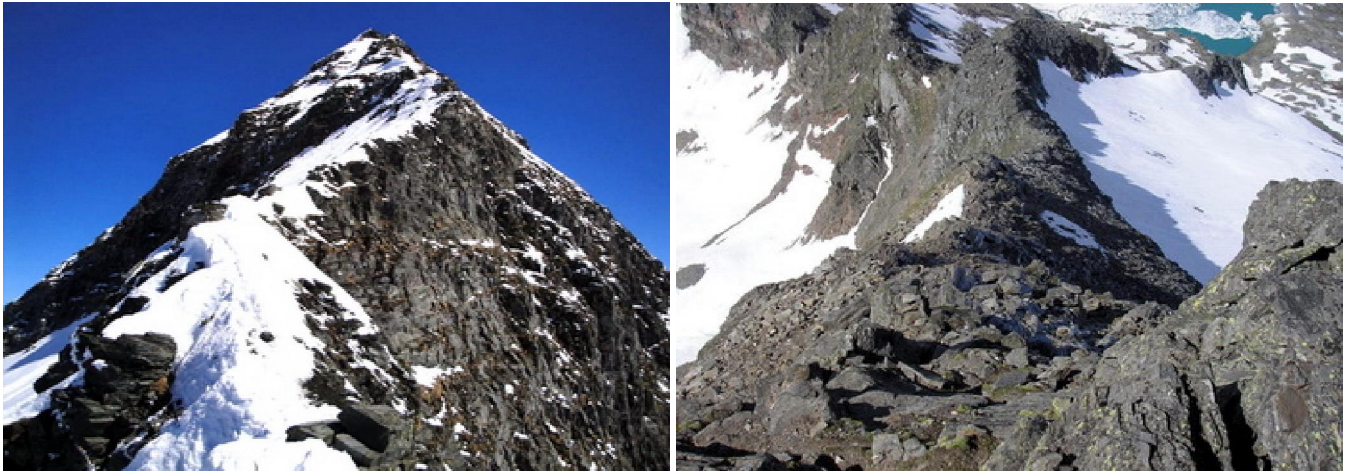
La cresta di salita: a sx ancora innevata, mentre a dx il percorso è completamente pulito.